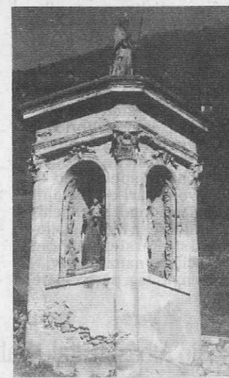
Il capitello di San Martino