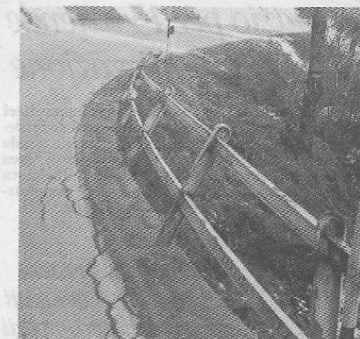
I pericoli della strada di Campiglio segnalati da Mancina Foto Povinelli Pinzolo

PINZOLO. Ingorghi col traffico fermo per ore ed ore, inconvenienti e di incidenti - una corriera finita in bilico con due ruote fuori dal ciglio della carreggiata - nei giorni scorsi sulla strada statale che da Pinzolo porta a Campiglio in occasione della nevicata che ha restituito l'aspetto invernale e prolungato la stagione.