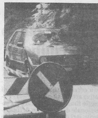
I pericoli della strada