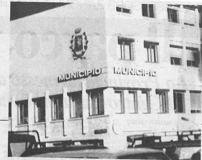
Il municipio di Pinzolo: si attendono nuove polemiche