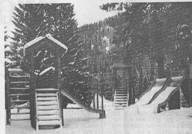
Il piccolo parco a Madonna di Campiglio