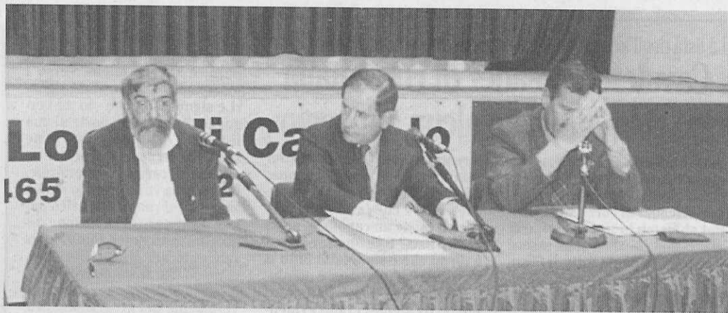
I tre candidati sindaco che aspiravano alla carica a Pinzolo

La netta riconferma del sindaco pone la questione dello strumento urbanistico