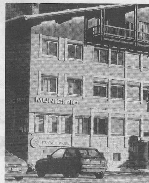
La giunta comunale impegnata con il nuovo Prg

Sviluppo della struttura alberghiera tradizionale ad integrazione con le altre attività produttive locali, in sinto-